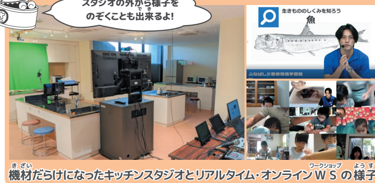
機材だらけになったキッチンスタジオとリアルタイム・オンラインWSの様子

これまで「生きもののしくみを知ろう」「海の恵みを味わおう」「ふなばしを食べつくそう」などの各WSに使われていたキッチンスタジオを自分達で改造し、ローコストながら本格的なネット放送の出来る設備が用意できました。解説画像、手元カメラの映像、顕微鏡カメラの映像をリアルタイムで解説者の映像と合成し、効果音もつけられるようにしました。